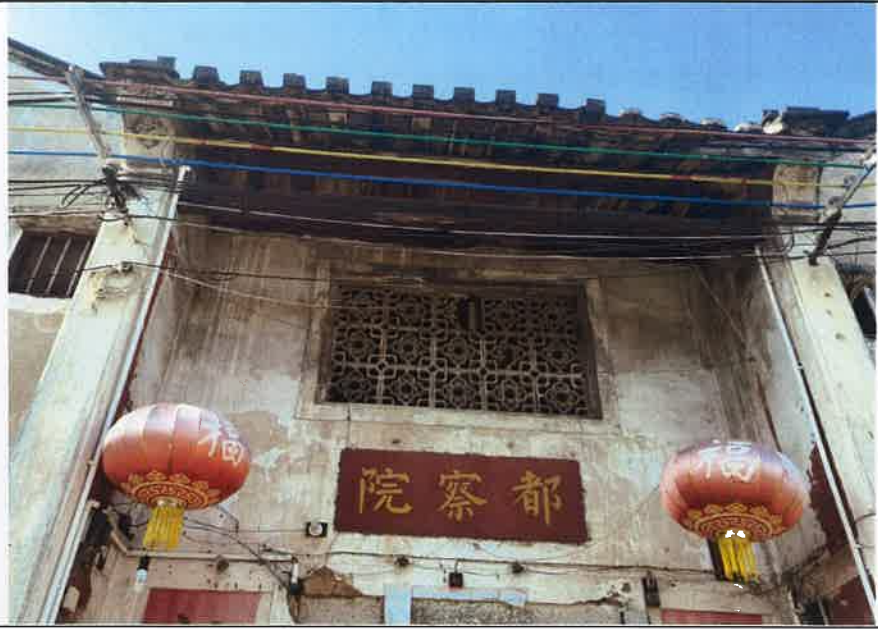
内部空间或内立面