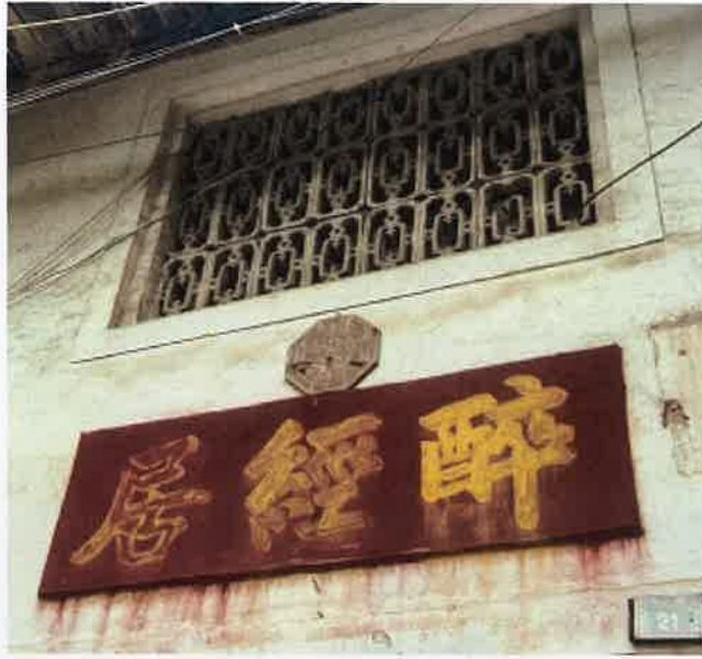
内部空间或内立面