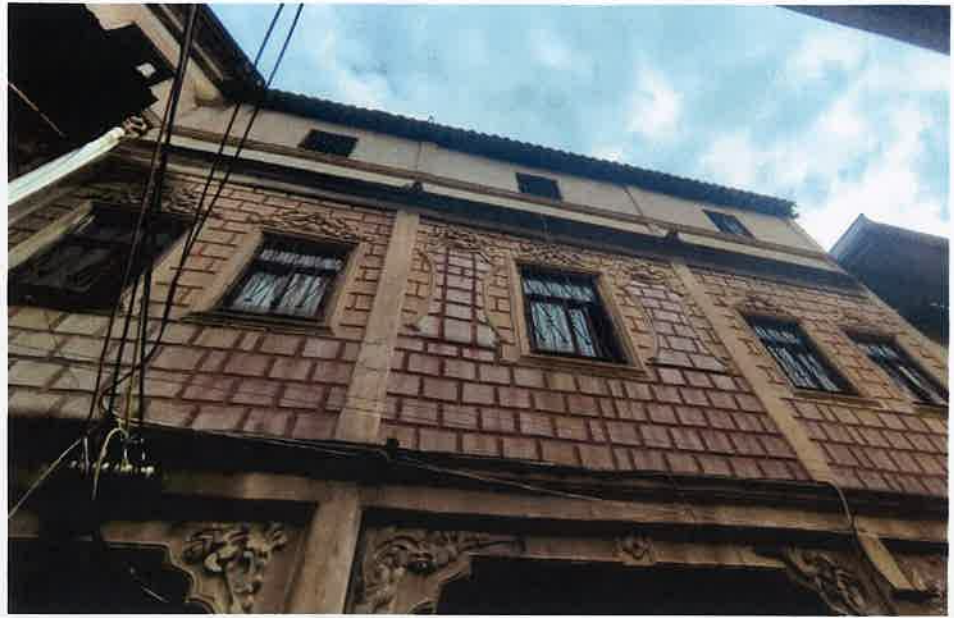
内部空间或内立面