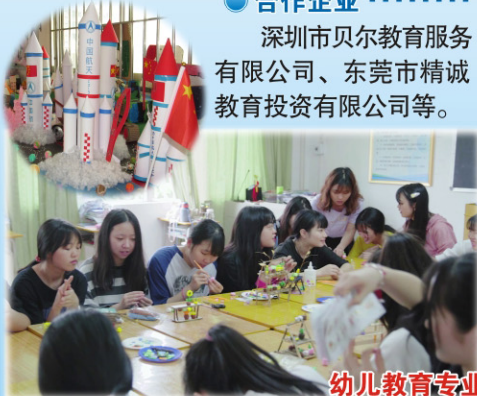
幼儿教育专业实训及作品展