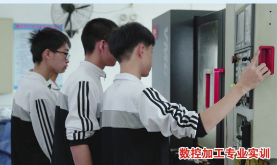
数控加工专业实训