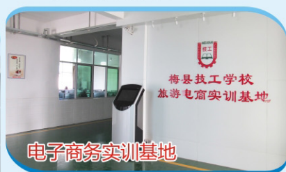
电子商务实训基地