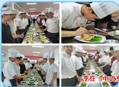
烹饪 (中式烹调) 专业实训