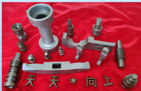
数控加工部分作品