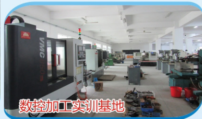
数控加工实训基地