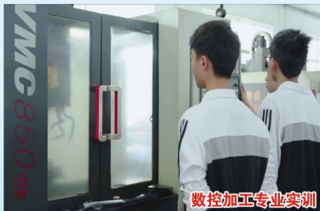
数控加工专业实训

东莞市怡合达自动化股份有限公司、BPW (梅州) 车轴有限公司、光洋六和 (佛山) 汽车配件有限公司、佛山市松川机械有限公司等。