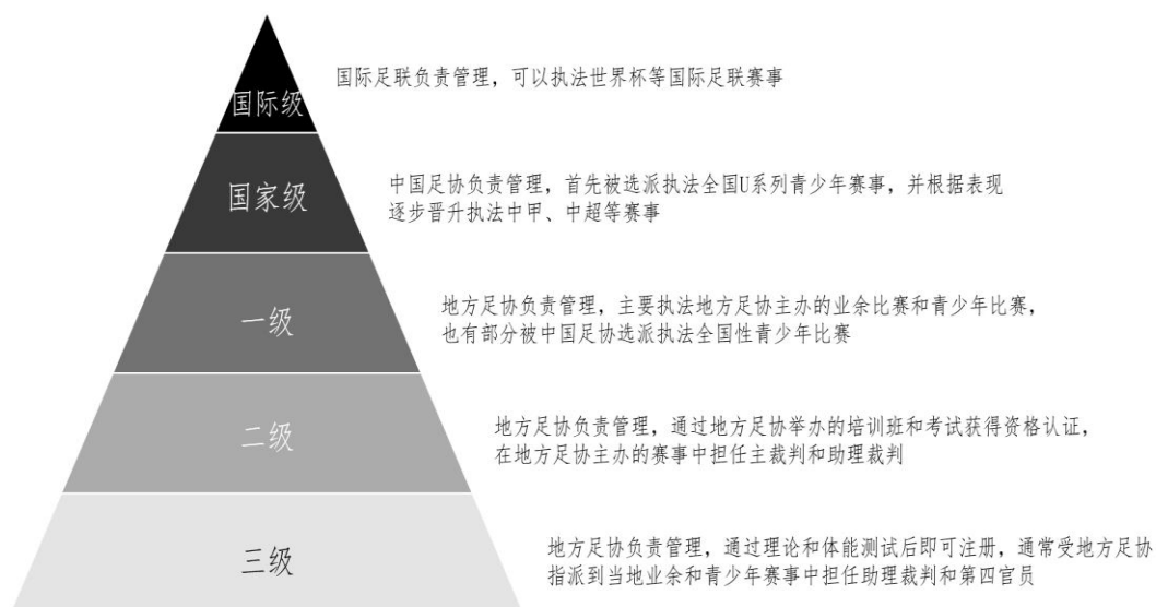
图：中国足球裁判员培养体系