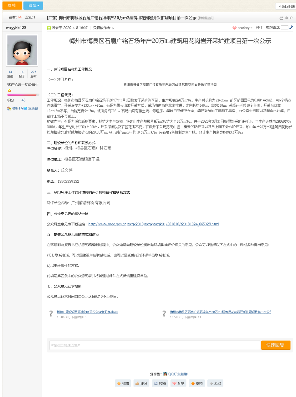
图 2.2-1 首次环境影响评价信息公开网页截图

本项目首次环评信息公开采取了网络公开的方式，于2020年4月8日在环评互联网网站进行第一次公示（ https://www.eiabbs.net/thread-270370-1-1.html ）。首次环境影响评价信息公开情况截图见下图。