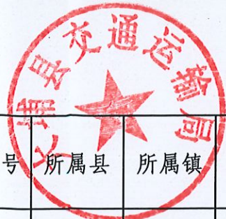
大埔县“四好农村路”建设攻坚项目完工情况公示表