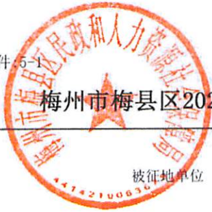
梅州市梅县区2021年度第十一批次城镇建设用地征地项目被征地农民养老保障费用情况表