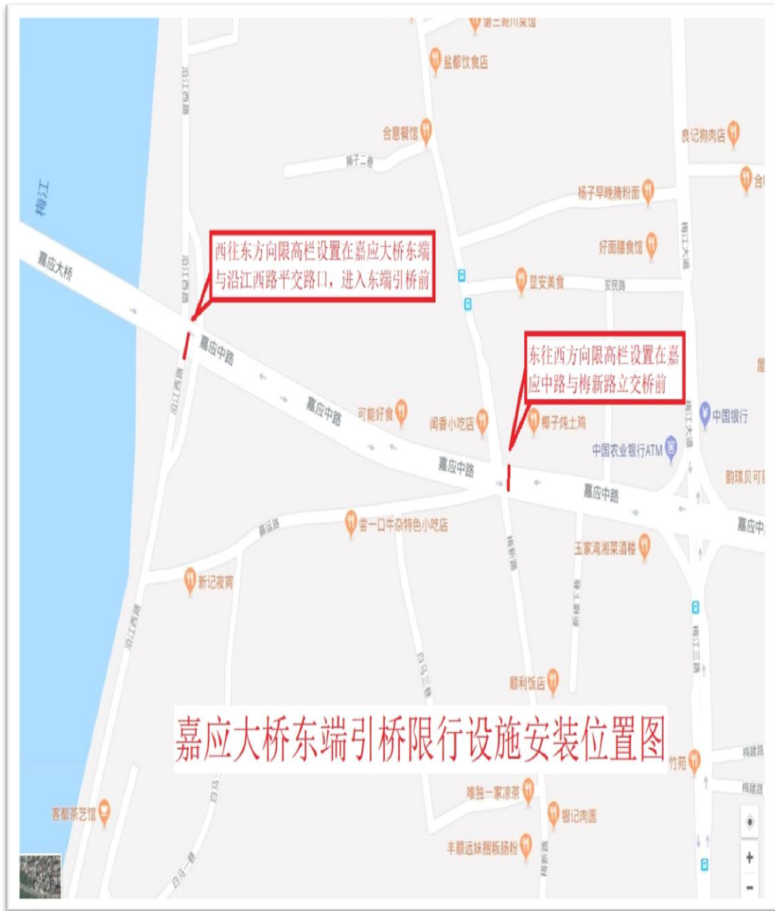
附图 1：限高架设置位置图